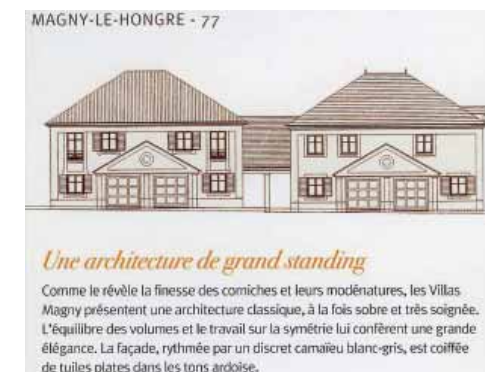
Détail de la Brochure Nexity pour Les Villas Magny.