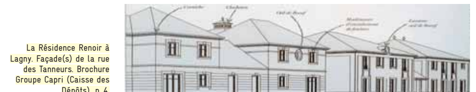
La Résidence Renoir à Lagny. Façade(s) de la rue des Tanneurs. Brochure Groupe Capri (Caisse des Dépôts), p. 4.

47. Signalons dans la liste des styles: Briard, Crystal Palace, Passage parisien, Haussmann, Nouvelle Athènes, Cottage, Ranch, New York, Nouveau Mexique. Ranch, New York et Nouveau Mexique sont cantonnés aux hôtels, pourvoyeurs de destinations exotiques. Les habitations monopolisent l'aspect « Paris capitale du (premier) xix e siècle ». La multiplicité des références est d'ordre programmatique, comme le confirme B. Durand-Rival: « À Val d'Europe, nous avons cherché à varier les références (...) Disons que l'architecture du Vd'E est référencée, qu'elle mobilise un système de références. » Voir