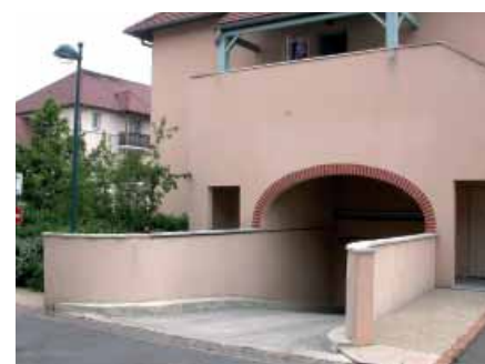
Sortie de parking souterrain à l'arrière du « corps de ferme ».

Mais cette substitution d'apparence fonctionnelle reste essentiellement symbolique, et superficielle: délibérée et fictive 56 . Le garage a de fait cessé de ressembler à l'écurie, comme l'indique, bon gré mal gré, la sortie du parking souterrain placé sous les appartements du principal « corps de ferme ».