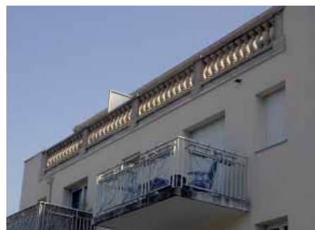
Rambarde de terrasse « Versailles ».