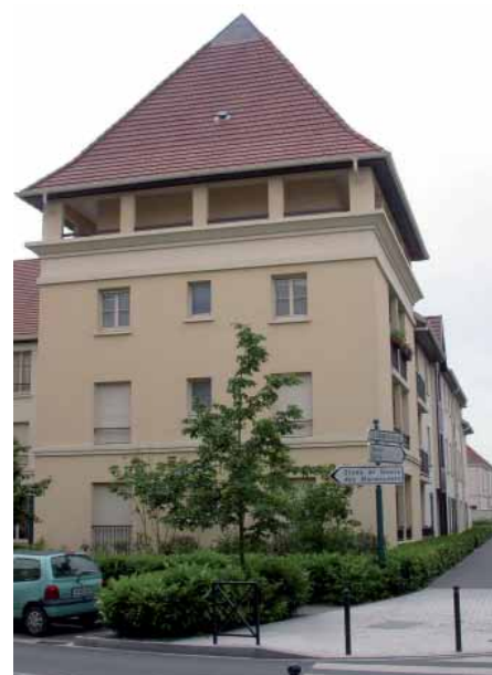
Toit « gallo-romain ».

Porteurs d'une « histoire » paradoxalement vague, car tissée de synthèses improbables, ils ont pour tâche d'évoquer un passé qu'ils ne convoquent jamais dans ses traces matérielles: cela obligerait à le doter d'une précision indésirable. Ce passé générique n'est pas sans rapports avec celui qu'évoque la « valeur d'ancienneté », jadis identifiée par Riegl comme un trait spécifiquement moderne. Lorsqu'une brochure de promoteur fait référence à une « architecture classique » – une nouvelle fois à partir de « détails » iconographiques identifiables comme tels (« modénatures », « corniches ») et de catégories générales (un improbable « équilibre des volumes » ou « travail sur la symétrie ») – pour désigner des bâtiments qui, par leurs volumes, par leurs couleurs, enfin par la coordination des « détails » iconographiques, ne rappellent aucun édifice historique susceptible d'autoriser l'usage de l'expression, c'est que le passé convoqué a cessé de s'identifier à un passé historique 57 . Il correspond bien davantage à la catégorie de l'ancien, et aux affects et valeurs propres qu'elle est censée convoquer.