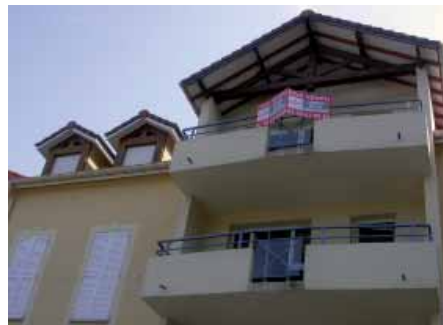
Toiture « villa basque ».

de fabrication de toute possibilité de relation physique avec le passé du territoire où ils sont inscrits. Ils donnent lieu à des associations purement imaginaires. Ils existeront alors fantasmatiquement au titre de traces futures d'un passé rêvé. Ces « traces à venir » prennent place, en l'occurrence, au côté d'autres détails fantasmatiques, ceux-là mieux identifiables comme tels, car beaucoup plus immédiatement perceptibles comme étrangers au territoire physique qui les accueille: ce sont les toits gallo-romains, balcons basques ou terrasses versaillaises qui abondent eux aussi dans le paysage.