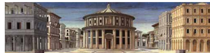
Luciano Laurana (?), Città ideale , Galerie nationale de la région des Marches, Urbino.

45. Ils offrent aussi un premier exemple de la « ligne claire » qui commande en général la réalisation visuelle des images « thématiques ». (Voir page suivante.)