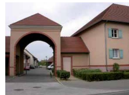
L'écurie et l'entrée de la « cour de ferme ».

discours marketing final se l'approprie, mais souvent ils préfèrent imaginer une autre histoire. » Voir infra , Annexe, « Une matinée... », loc. cit. Sur la différence entre la « représentation projective » moteur du projet et sa « représentation descriptive » en termes de marketing, voir supra P. Chabard, « L'asuburbia... », chapitre « Effectuer: la rhétorique de l'action ».