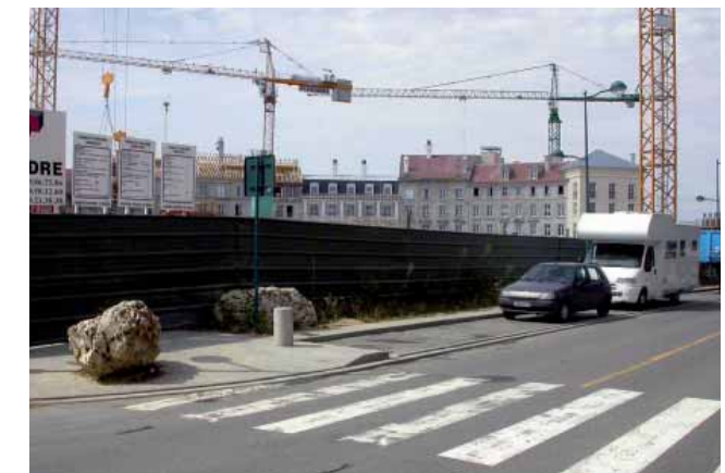
La place de Toscane en construction, depuis le cours de la Garonne, juillet 2005.

Le phénomène est accentué par le caractère disparate des références. Cette réalisation « d'inspiration italienne » assemble en effet divers styles d'immeubles urbains européens du XVIII e et du XIX e siècles 50 . Leur mise à l'échelle, qui donne à l'ensemble l'aspect d'une maquette légèrement inférieure à l'échelle 1/1, produit à elle seule un effet de décor prononcé. Ce ne sont d'ailleurs pas tant des édifices « italiens » qui entourent la fontaine « romaine » censée fournir son ancrage à la place (malgré sa position légèrement excentrée dans l'ellipse), que des façades néoclassiques ou pré-haussmaniennes de synthèse. Sans jamais citer de bâtiments précis, elles ramènent à Londres, Paris, ou autrefois Berlin, aussi bien qu'à Rome ou à Parme. Cet éclectisme affirmé 51 donne à la place son irréalité – auquel son nom de Toscane ajoute une touche supplémentaire d'arbitraire. Hormis un passage « giottesque » engoncé entre deux autres maisons de ville, qui ne déparerait pas les fresques franciscaines d'Assise, aucun des bâtiments édifiés n'évoque à proprement parler l'architecture toscane de la Renaissance, pourtant censée cautionner ce choix de nom. Mais peut-être est-il ici plutôt question de la Toscane du XIX e siècle,