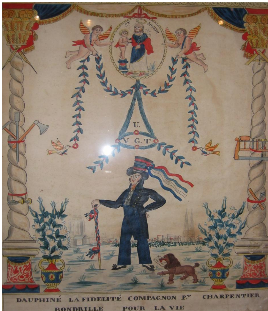
Souvenir du Tour de France de Dauphiné la Fidélité, compagnon passant charpentier (dessin à la plume rehaussé d'aquarelle et de gouache). Fait par Leclair, vers 1830. Musée du compagnonnage, Tours.

Les charpentiers et les couvreurs du Devoir sont parmi ceux qui sont le plus explicites, rappelant dans les légendes et textes qui accompagnent ces tableaux que le compagnon à qui on les remet est « bondrille pour la vie ».