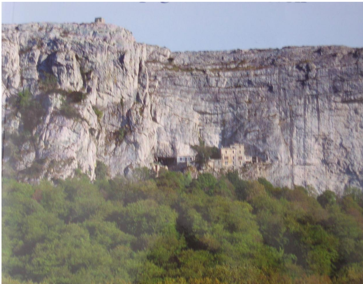
Le massif de la Sainte-Baume : la forêt, la grotte et la crête su Saint-Pilon.