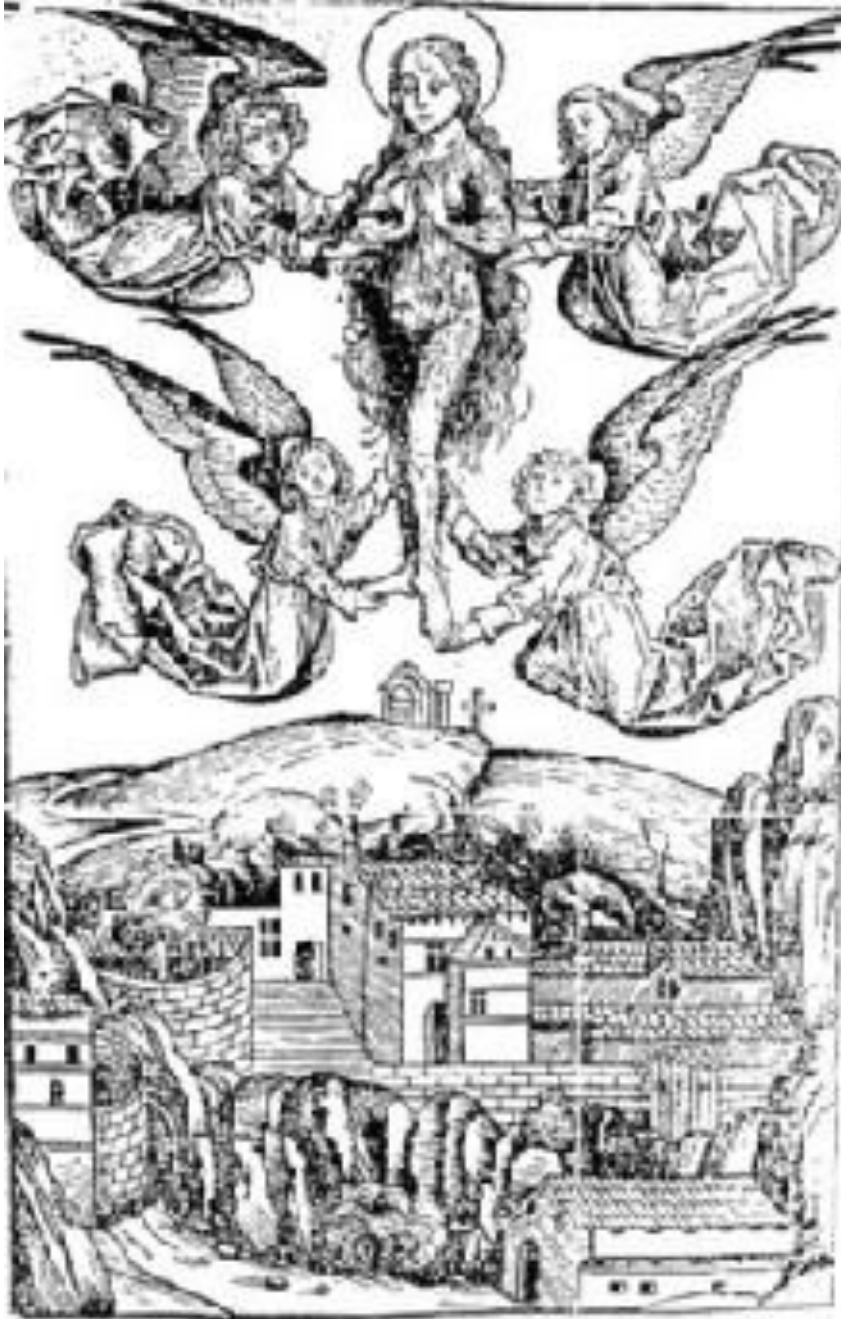
Marie-Madeleine, figure du « sauvage en personne ». Gravure sur bois extraite du Liber Chronicarum (1493) d'Hartmann Schedel (BNF).