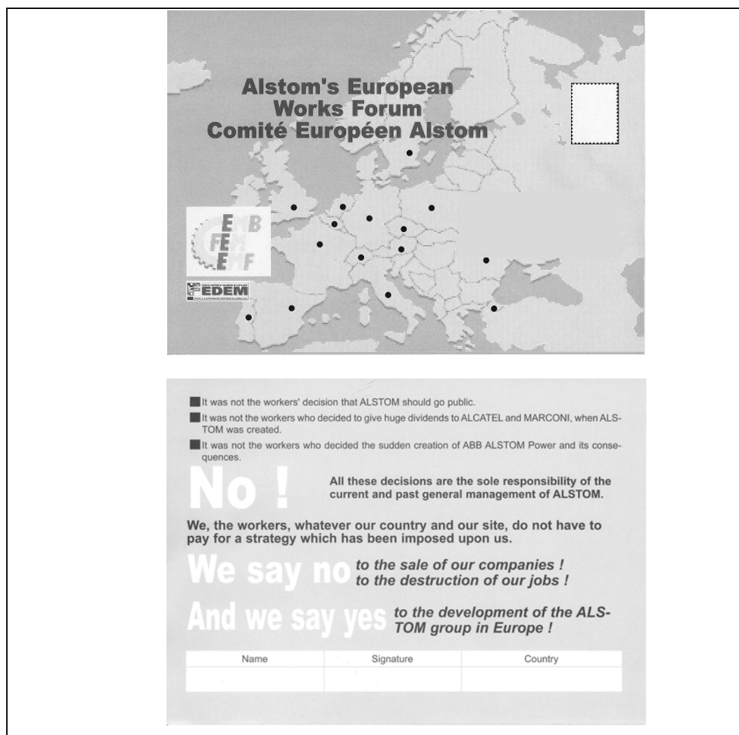
Carte-pétition Comité d'entreprise européen d'Alstom

direction à l'absence de voix des salariés sur ces questions. On remarque également que l'unité des salariés du groupe « quel que soit leur pays ou leur site » est ici mise en avant. Cette pétition n'est motivée par aucune demande explicite, mais vise essentiellement à réaffirmer les positions (« we say yes ») et à souligner les désaccords (« we say no ») entre les parties, s'inscrivant ainsi pleinement dans le registre de la dénonciation du plan de restructuration.