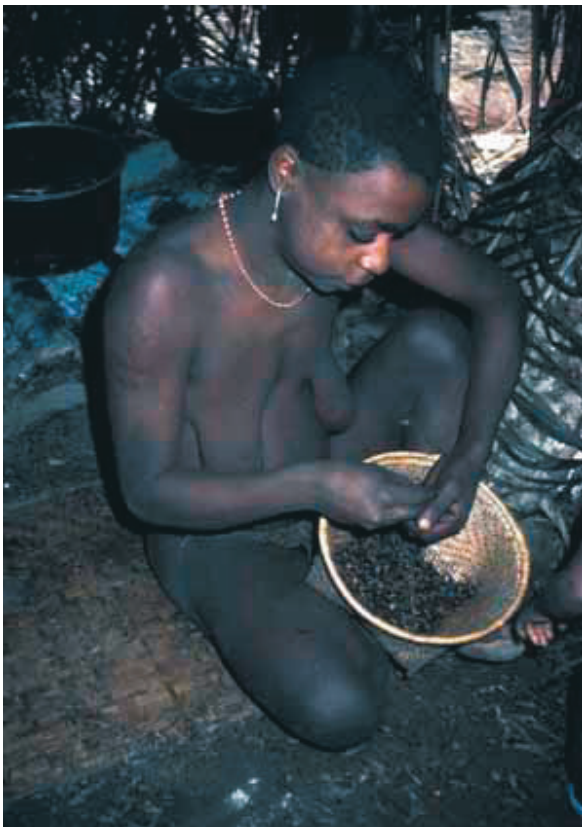
Figure 6 : Les termites sont collectés, au moment de l'essaimage, par les populations forestières d'Afrique centrale et leur goût de noisette, relevé d'un peu de piment en fait un mets fort apprécié.

On a pu voir aussi les réactions surprenantes des chimpanzés que Sabrina Krief a observés dans la forêt de Kibale, en Ouganda, en fonction de la présence de ces substances dont l'effet est toxique à forte dose mais dont des effets bénéfiques ont été démontrés. Certains des produits consommés exceptionnellement par les chimpanzés ont une activité contre la malaria et peuvent même avoir une activité améliorée par de petites quantités de terre que le chimpanzé avale, simultanément ou presque. Cette « automédication » des chimpanzés pourrait-elle être plus ou moins consciente ? L'expérience accumulée par un individu ou une tradition du groupe ne semble pas à exclure.