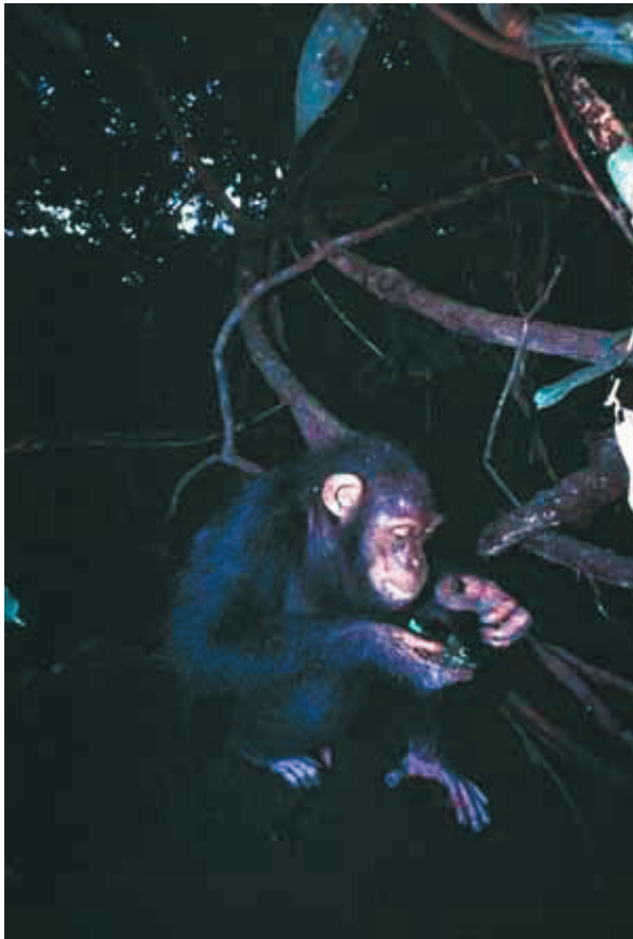
Figure 5 : Les insectes, termites et fourmis (ici un nid de fourmis œcophylles, ouvert avant d'en consommer le couvain), participent à l'équilibre protéique du régime du chimpanzé. Ils constituent surtout une ressource en graisses particulièrement appréciée.

unes des autres. La comparaison pourrait s'arrêter là, car les différences d'accès aux ressources alimentaires entre les mâles et les femelles sont bien moindre que dans les cas décrits plus haut, où la surface exploitée par les groupes d'espèces sympatriques de semnopithèques ou par les macaques du Sri Lanka, diffère d'un facteur 10, ainsi que le nombre d'espèces végétales dispersées qu'ils consomment.