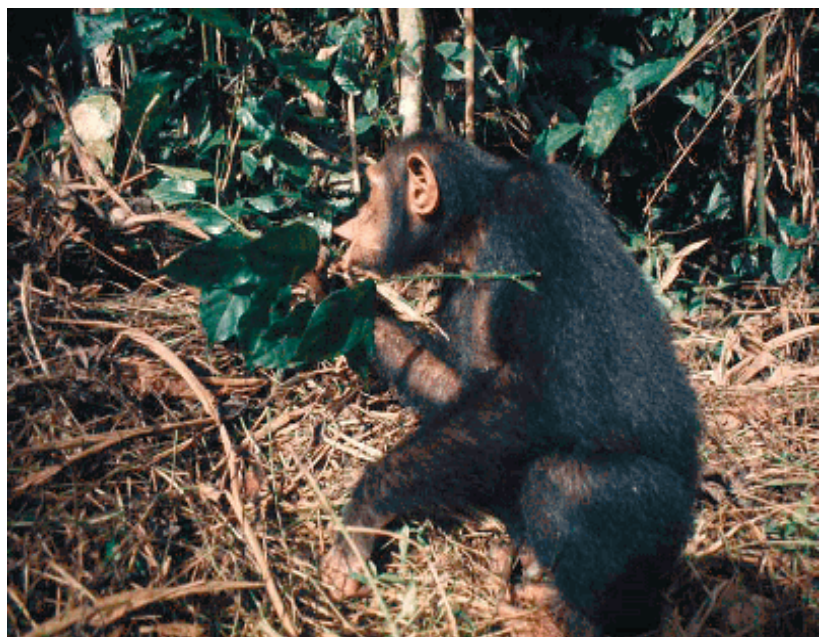
Figure 4 : Les feuillages des légumineuses, notamment ceux de Baphia leptobotrys , constituent une part importante des apports protéiques.

sont beaucoup moins mobiles que les mâles), on retrouve un système d'utilisation des ressources correspondant à celui des Galagos ( Galago demidovii ), un petit prosimien que Pierre Charles-Dominique avait étudié dans la forêt du Gabon. Ce système primitif donne accès à un mâle plus mobile, à des ressources plus diversifiées, sur une plus grande surface exploitée. Toutefois, dans le cas du Galago, le plus grand territoire est occupé par un seul mâle, et se superpose à ceux de plusieurs femelles, isolées les