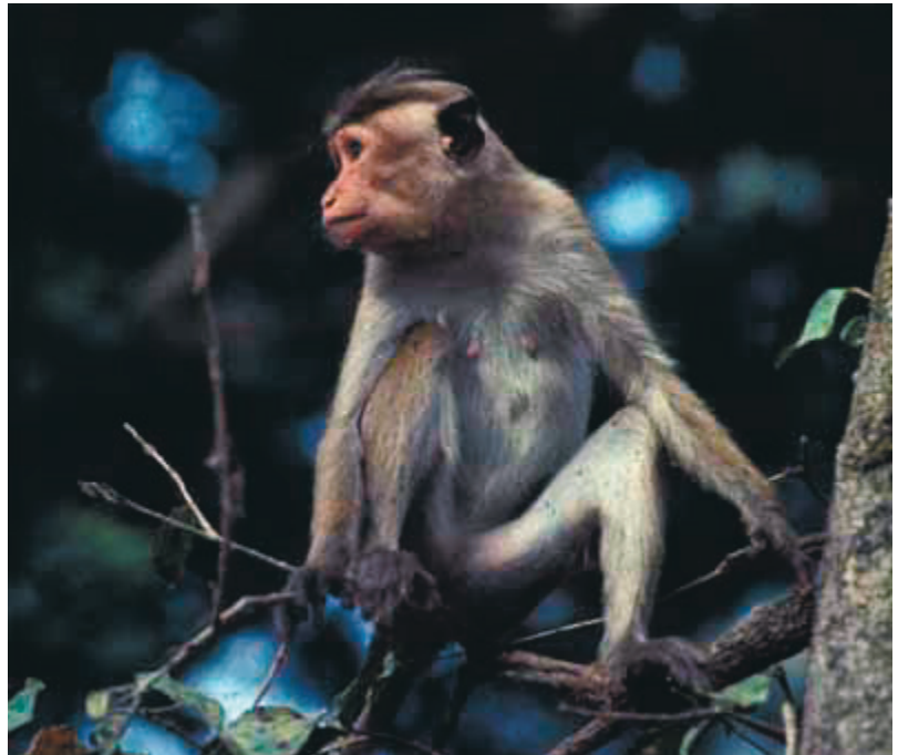
Figure 2 : Le macaque ( Macaca sinica ) qui, au Sri Lanka, cohabite avec les semnopithèques, est beaucoup plus sélectif dans ses choix d'une très grande diversité de végétaux dont il sélectionne quelques éléments. Il peut consommer les pétioles des feuilles de ce Strychnos potatorum .

antage frugivore, nécessite des déplacements autrement plus importants pour trouver les ressources les plus riches, disséminées sur d'immenses territoires qui débordent notre terrain d'étude de plus 100 hectares. En fait, nous avons là un modèle qui nous permet de comprendre une partie des adaptations au régime alimentaire. Les macaques, comme les saïous d'Amérique, les chimpanzés et très probablement les premiers hominés, doivent ressentir une forte motivation pour trouver, chaque jour, des ressources dispersées mais variées et riches en énergie. Qui dit motivation, dit nécessairement récompense, c'est-à-dire que les primates utilisant les fruits les plus riches en sucres en perçoivent aussi l'agréable saveur, ce qui les encourage à poursuivre leur longue et exténuante quête alimentaire. Et nous savons que le plaisir immédiat que procure la perception d'aliments sucrés entraîne une sécrétion de substances de la famille des opiacées dans le centre du plaisir de l'encéphale. En revanche, pour les primates les moins mobiles comme les semnopithèques qui utilisent les ressources les plus abondantes mais moins riches en sucres ou en graisses, la réponse comportementale dépendra davantage du système de motivation par l'effet bénéfique à plus long terme qui, en fonction des réponses de l'hypothalamus et de la charge en glucose du flux sanguin, détermine une apaisante sensation de satiété.