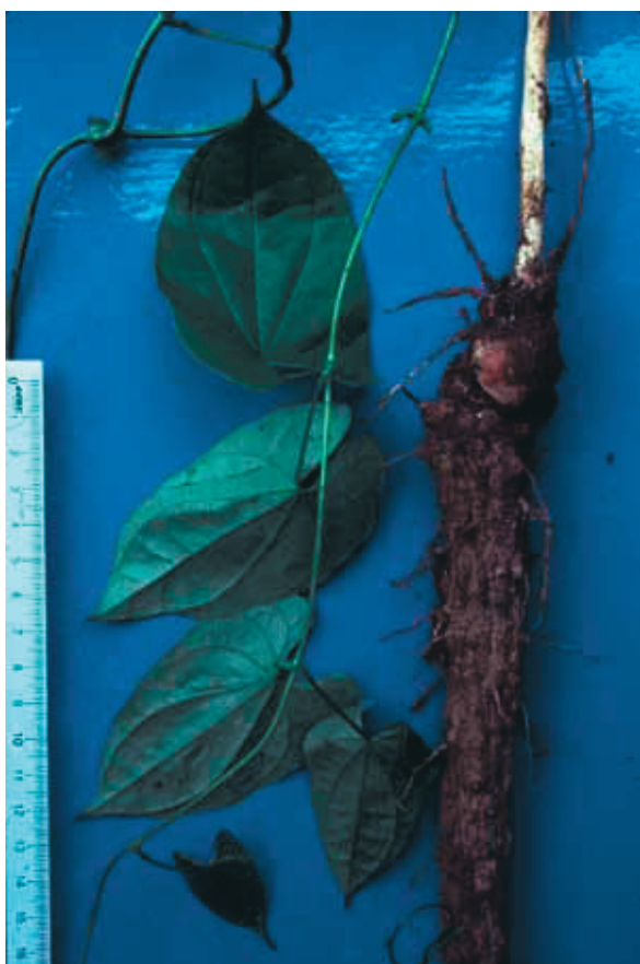
Figure 8 : Une des nombreuses espèces d'ignames des forêts denses africaine, Dioscorea praehensilis , dont les tubercules, peuvent apporter, surtout après cuisson, l'important apport calorique qui fut nécessaire au métabolisme de l'encéphale du genre Homo .

Mais qu'en est-il de la viande des petits gibiers, antilopes ou colobes, que les chimpanzés capturent au cours de chasses collectives et qu'il dégustent avec plaisir en se partageant lentement les morceaux ? On a dit aussi qu'il s'agissait là des origines de l'homme chasseur, qui rapporte le gibier au campement. Ce n'est pas vrai des chimpanzés qui font le partage entre mâles adultes (alors que ce sont les femelles et les jeunes qui auraient besoin de protéines animales). De plus, bien que des chiffres plus élevés aient été trouvés en d'autres lieux, la mesure des fréquences et des quantités moyennes ingérées à Gombe indique un apport de protéines animales cinq fois inférieur à celui des insectes.