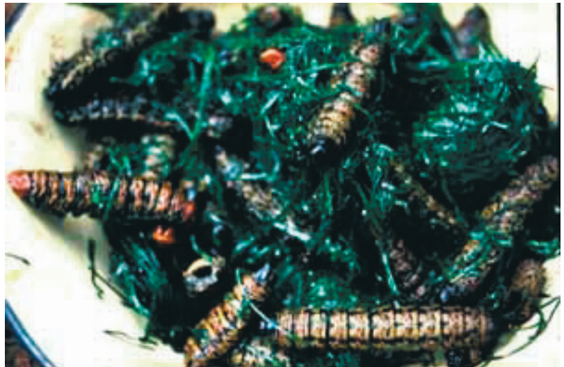
Figure7 : Les chenilles constituent encore, pour les populations forestières, un aliment abondant et riche en graisses. Cuites avec des feuilles de Gnetum , elles constituent un plat délicieux.

Les chimpanzés consomment préférentiellement les insectes les plus gras, ce que nous avons montré sur les échantillons de termites que Richard Wrangham avait recueillis dans la forêt de Gombe, en Tanzanie. L'apport en corps gras est toujours aussi important en ce qui concerne les insectes actuellement consommés par les populations forestières, notamment en Afrique forestière où les termites grillés et légèrement pimentés constituent un plat apprécié. Il en est de même pour les chenilles de nom-