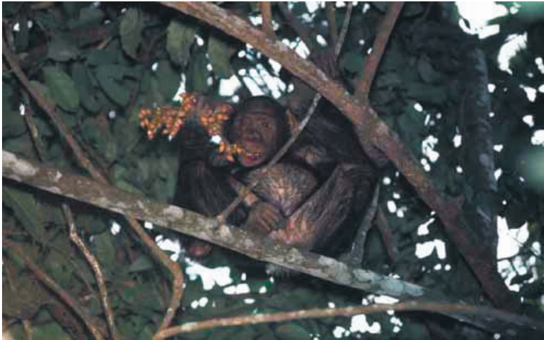
Figure 3 : Des fruits très variés, ici ceux du Calamus deeratus de la forêt du Gabon, apportent l'essentiel des apports caloriques à un chimpanzé.

Chez les grand singes, chimpanzés, bonobos, gorilles ou orang-outangs, on observe cette relation globale entre les régime alimentaire et l'utilisation de l'espace en relation avec les structures sociales des groupes qui est liée, comme nous l'avons vu, à la perception et à la composition des aliments. Il est intéressant de noter que pour les chimpanzés, Pan troglodytes paniscus , dont Richard Wrangham avait noté l'utilisation différentielle des vastes territoires par les mâles et par les femelles (qui