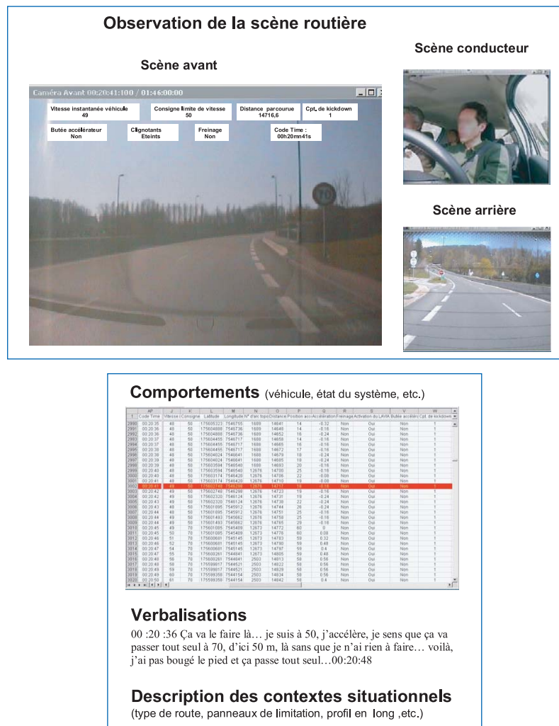
Figure 2. Éléments pris en compte pour l'analyse des données recueillies en situation de conduite

Les entretiens réalisés lors des différentes phases de l'étude sont intégralement retranscrits et font l'objet d'une analyse de contenu.