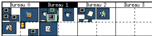
FIG. 1: Un pager qui représente quatre grands bureaux virtuels (2x2).

La plupart des gestionnaires de fenêtres X Window possèdent un espace de travail virtuel. Le modèle le plus commun est une suite de bureaux virtuels indépendants entre eux de la taille de l'écran. Certains gestionnaires de fenêtres proposent de grands bureaux virtuels : une matrice n \times m consitutée de pages de la taille de l'écran. La navigation dans l'espace de travail virtuel peut revêtir différentes formes. L'un des outils utilisés est un gestionnaire d'espace virtuel ou pour être plus concis un pager . Cet outil reproduit une vue miniature de tout l'espace de travail comme dans la Figure 1.