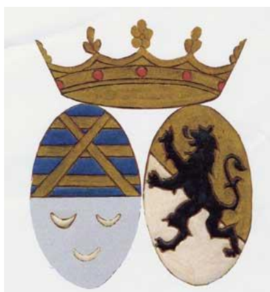
Figure 1 - Armoiries des Barons de Saint-Amand

Nous pensons avoir donné à présent suffisamment d'informations d'ordre généalogique sur les acteurs que nous allons rencontrer dans l'histoire de la forge de Montiers, qui fait suite.