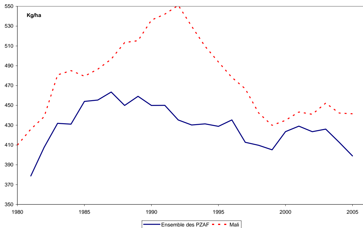
Figure 2 : Régression du rendement coton fibre dans les PAZF et au Mali Figure 2: Cotton lint yield regression in African Franc Zone countries and in Mali