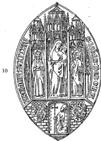
S. IOH[ANN]IS DEI GR[ACIA] ARCHIEP[ISCOPI] AVXITANI.