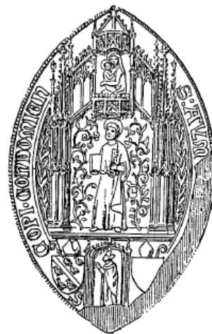
S. AYM[ERICI] EPI[SCOPI] CONDOMIEN[SIS].

Source : LAPLAGNE-BARRIS, Sceaux gascons du Moyen Age , vol. 1, p. 8, 20.