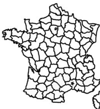
Carte 2 : Localisation géographique de la réserve naturelle des gorges du Gardon.

La réserve naturelle des Gorges du Gardon est située (Carte 2) dans le département du Gard sur la commune de Sanilhac-Sagriès proche de trois grandes agglomérations Uzès, Nîmes et Avignon. Elle est au centre du massif et des Gorges du Gardon qui couvrent environ 20 000 hectares de la garrigue nîmoise.