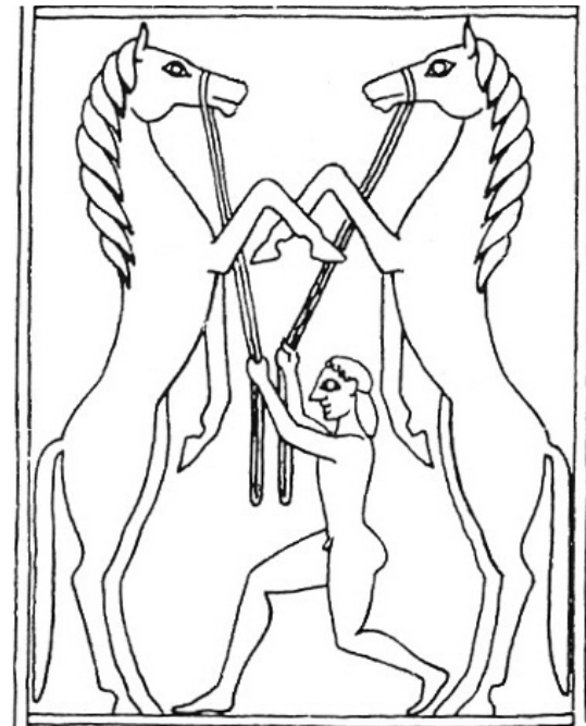
Fig. 5: Plaque décorée de bouclier en bronze, Olympie, n° B 987, VII e siècle av. J.-C. (dessin d'après Kunze 1950).