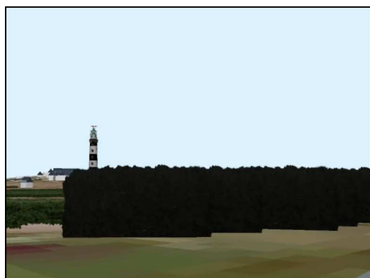
Fig. 1. Exemples de simulations 3D réalisées selon un scénario d'évolution paysagère déterminé

La modélisation d'accompagnement et plus particulièrement le jeu de rôle a été analysée pour identifier les résultats obtenus, comprendre les atouts et les freins liés à la problématique ouessantine, et étudier son applicabilité à un autre contexte géographique et les modalités de transfert à une collectivité territoriale (Chlous-Ducharme et al. , 2008).