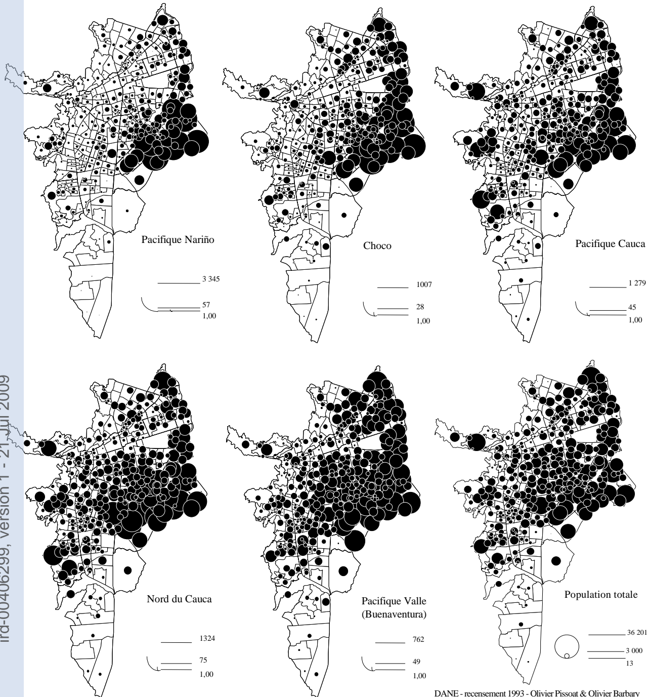
Figure 3 : distribution de la population par secteur cartographique de recensement selon le lieu d'origine*

DANE - recensement 1993 - Olivier Pissot & Olivier Barbary