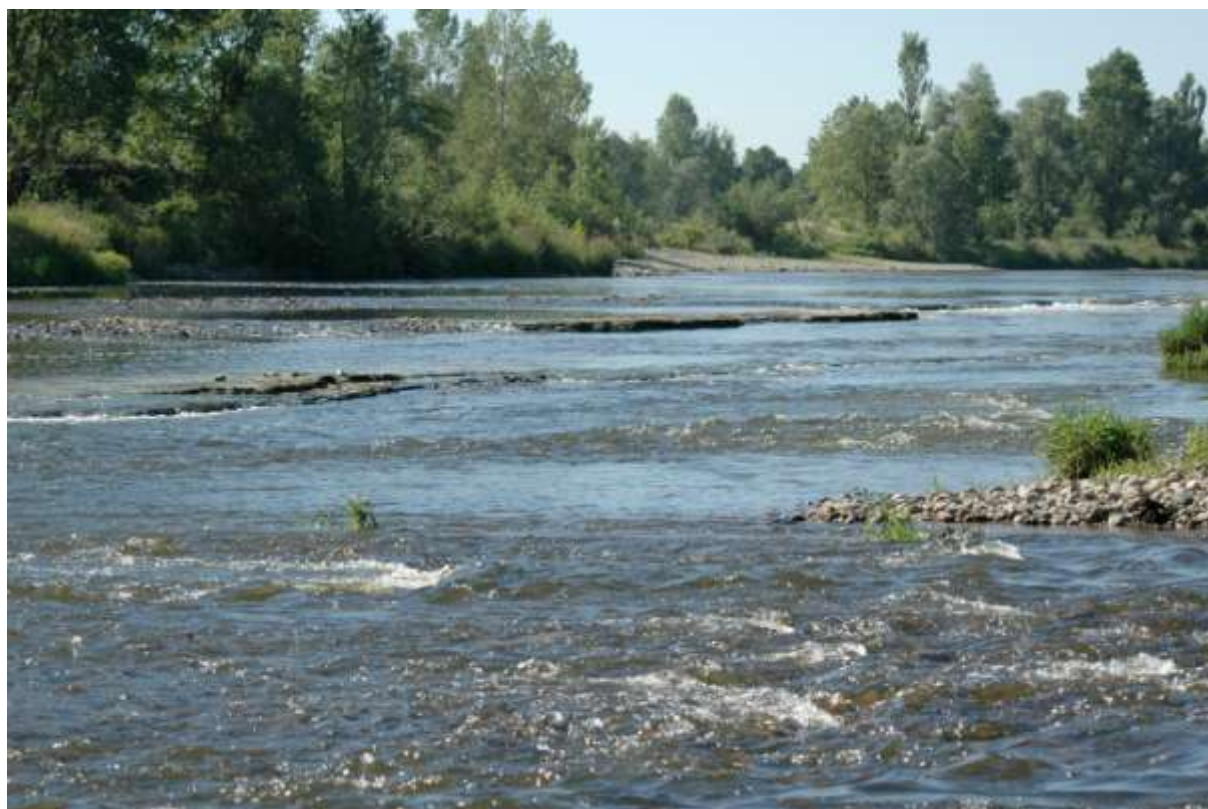
Figure 3 : Le fleuve Loire dans la Plaine du Forez : bancs de marnes émergés, témoins de l'incision du lit (R. Déchomets, centre SITE)

4. Identification des usages et des pressions anthropiques. Sur la base d'un corpus documentaire et d'enquêtes visant à prendre en compte les parties intéressées [17] un état des lieux et des scénarios d'évolution de la demande et des besoins en eau par rapport à la ressource disponible seront établis. Sur la base de ces informations, des simulations seront réalisées à l'aide du modèle de nappe.