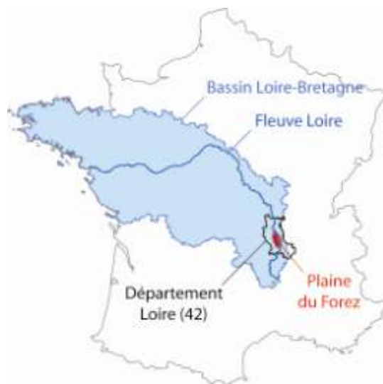
Figure 1: Localisation de la Plaine du Forez (Données : IGN BD Carthage ; ARCGIS 9.2., Adobe illustrator)

Les enjeux liés à 2 outils de gestion de l'eau ont ainsi été pris en compte :