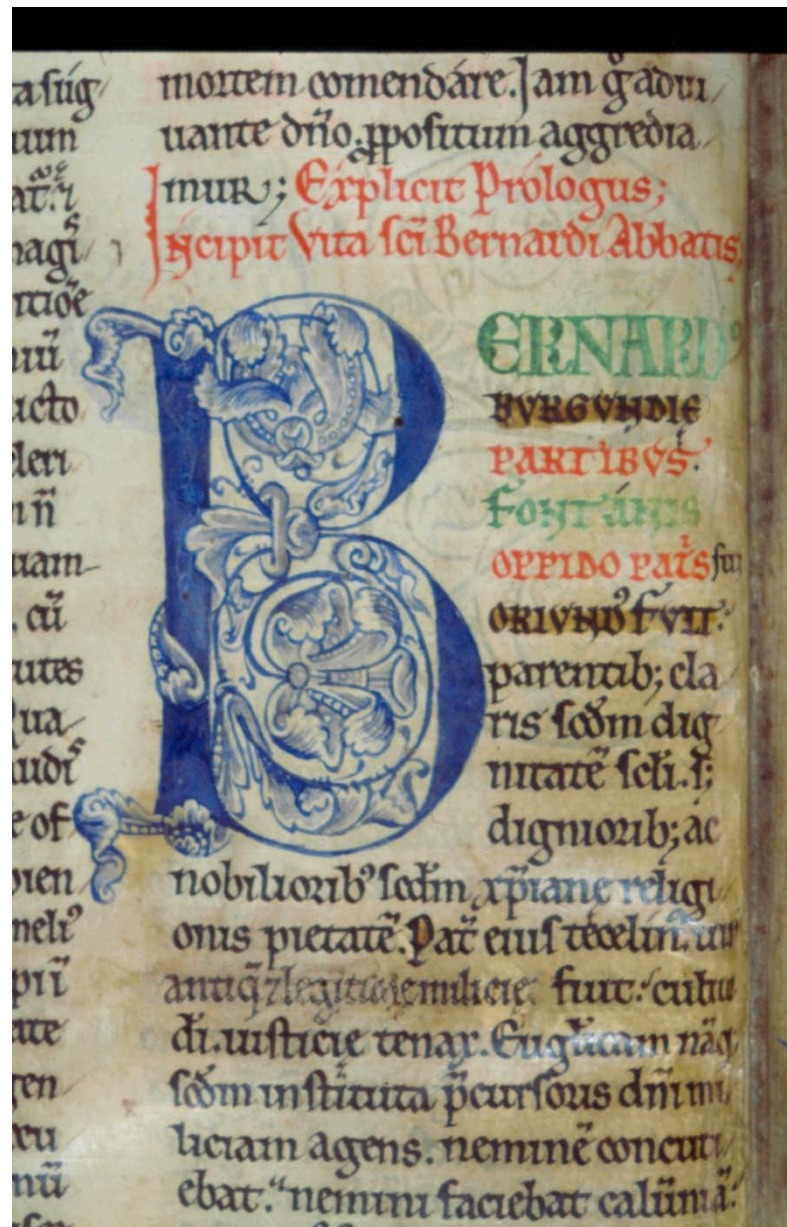
Dijon, B.M., ms. 659, fol. 3v : début de la Vita Prima .

Laurence Mellerin, CNRS, Institut des Sources Chrétiennes