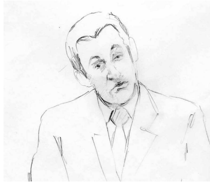
Fig. 6 : après « méfiez-vous » (TP10b)

Cette mimique bienveillante et de bon aloi (sourire, inclinaison latérale de la tête avec regard co-orienté) va se répéter sous une forme outrancière en 10b,