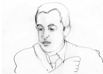
Fig. 3: poing fermé sur « cet effort »

alors demandez\ (.) aux musulmans de France\ (.) de faire cet effort d'intégration