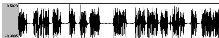
Fig. 1: le signal du début de TP1 (durée 30 s.)

En ce qui concerne la prosodie, signalons surtout la fréquence de ces segments de phrase accompagnés d'une mélodie fortement descendante et suivis d'une pause intra-tour remarquablement longue, comme le montre l'analyse du signal (début de TP1) :