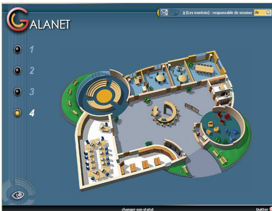
Figure 1. Galanet – Interface d'accueil

Le scénario d'encadrement , quant à lui, a été élaboré au fil des sessions. Initialement prévu sous forme d'accompagnement souple et proactif, sans autre spécification particulière, et laissé à l'appréciation de chaque équipe, le rôle des tuteurs s'est progressivement affiné, du fait notamment de l'insertion curriculaire de la formation 24 . Deux initiatives ont contribué à renforcer et à structurer la dimension tutorale à distance : l'élaboration d'une «charte d'utilisation de Galanet» 25 , destinée à réguler et à soutenir la participation des étudiants aux forums et aux chats, et la mise en place d'une formation des tuteurs, conçue également à distance, mais à partir d'un autre environnement numérique de travail 26 . Cette formation, prévue sur une durée de cinq semaines environ, définit et exemplifie, par une démarche réflexive, les fonctions du tuteur à chaque étape de la session et clarifie la nature de ses interventions pour chaque type de fonctionnalité utilisée.