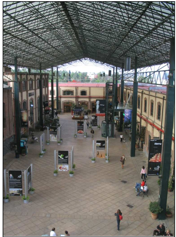
Photographie 2 : La nef de Plaza Loreto

Pour saisir leurs modalités de fréquentation, il faut d'abord préciser qu'en général les pratiques qui se développent dans les complexes commerciaux récréatifs sont, outre l'achat, la promenade avec laquelle il s'imbrique étroitement par le lèche-vitrines, et de nombreuses autres activités récréatives qui impliquent également une socialisation par la consommation, comme la rencontre pour une séance de cinéma ou de bowling, la discussion autour d'un repas, etc. C'est donc surtout leur offre globale qui conditionne leur fréquentation.