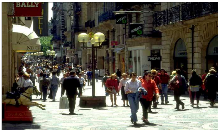
<Fig. 4 : Un paysage de mall pour un cœur de ville « franchisé »>

Au cours des années 1970, des opérations de piétonnisation ont concerné d'anciennes artères romaines et médiévales pour revaloriser les centres historiques de certaines villes, les métropoles régionales en particulier. Ce recyclage a ouvert la voie à leur revitalisation commerciale. C'est ainsi que la rue Sainte-Catherine, cardo romain longue de 1,2 km (plus longue rue commerçante d'Europe selon les Bordelais), a été piétonnée en 1977. Ce type d'opération a induit une prédominance d'enseignes franchisées pour produire un paysage commercial semblable à celui des malls , selon le processus de transformation des centres historiques décrit par D. Mangin (2004).