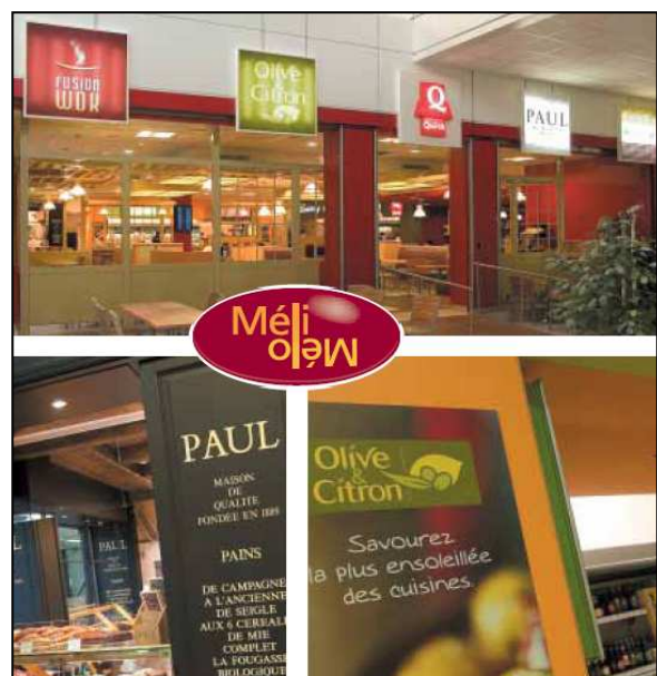
<Fig. 2 : Méli-Mélo, concept récent de food court spécifique aux aéroports ( www.nice.aeroport.fr )>

Ces galeries s'apparentent d'ailleurs à leurs homologues des malls , car leur offre s'avère encore plus variée en types de commerces que les aires d'embarquement : on y trouve en effet diverses boutiques, notamment de souvenirs, de bagagerie, de presse, mais aussi de mode, des locaux de services -dont un spécifique à ce lieu, les agences de voyage-, et surtout des lieux de restauration. Ce dernier type de commerce montre particulièrement bien le problème d'accorder des temporalités disjointes (vitesse/achat plaisir) auquel est confronté l'ensemble de la galerie marchande.