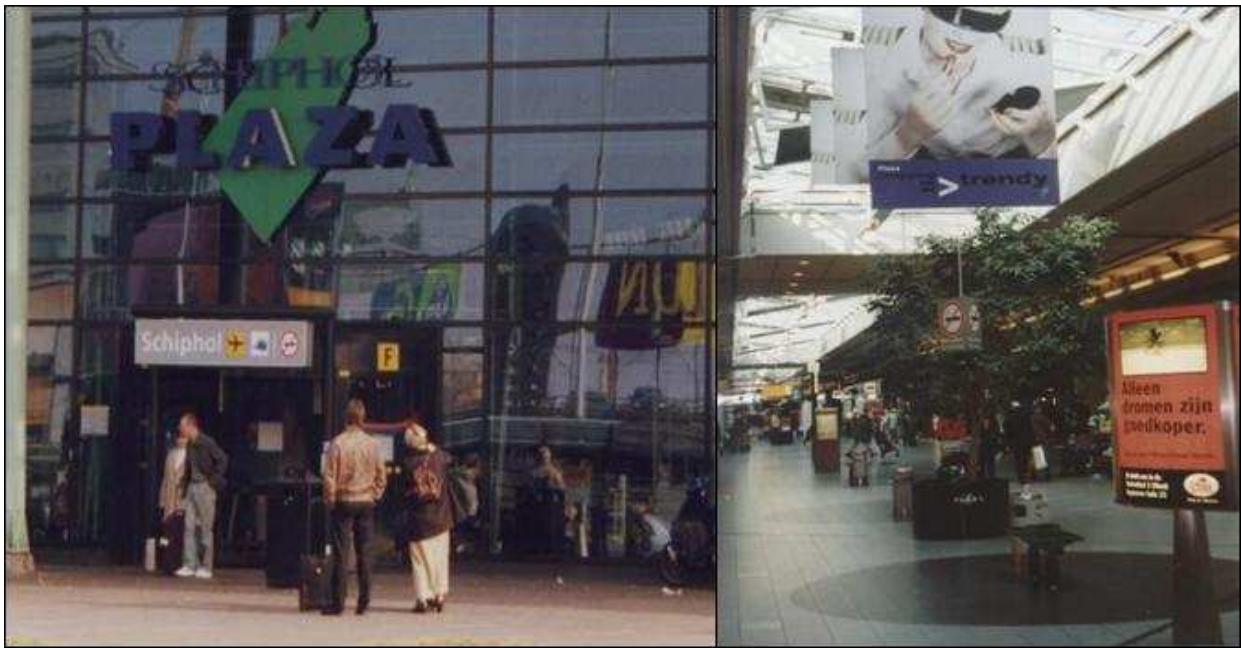
<Fig. 1 : L'aéroport Schiphol Plaza et sa galerie marchande>