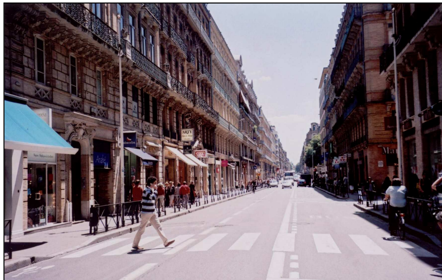
<Fig. 5 : La rue Alsace-Lorraine, avant -juin 2007- et après -depuis septembre 2007->

Dévolue aux transports collectifs, empruntée par les automobiles, son réaménagement récent est la pièce manquante à la constitution d'un vaste plateau piétonnier à l'échelle de l'ensemble du centre historique. La rue Alsace-Lorraine est le centre de gravité de ce plateau bordé par la ligne B de métro, récemment ouverte. Une circulation de transit s'y effectue parfois avec une valise à roulette, à l'instar des aéroports.