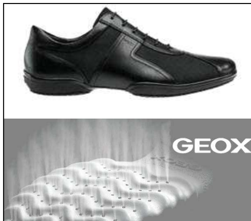
<Fig. 3 : Le concept Géox ( www.geox.com )>

A présent lieux de transit renouvelés par l'intermodalité, certaines qualités du déplacement à pied sont mieux révélées : technique légère et flexible, « boîte de vitesse » aisément modulable au gré des circonstances et des envies, mode de déplacement le plus rapide en hypercentre avec le vélo, l'encombrement en moins, la marche devient un instrument de la glisse urbaine (Chevrier et Juguet, in Marzloff, 2005). Ainsi, les chaussures italiennes Géox avec la technologie des semelles Respira , sont le symbole d'une sophistication surmontant certaines contradictions contemporaines en alliant contrainte et loisirs, élégance citadine et efficacité sportive. Elles représentent l'aboutissement de tendances successives par l'hybridation des Nike Air et de la chaussure de ville, comme bien d'autres marques affirmant cette tendance lourde.