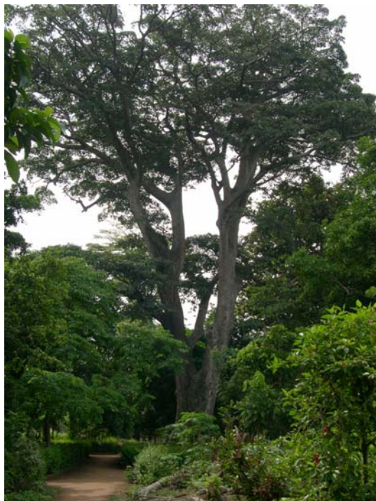
Le Jardin des plantes et de la Nature, Porto Novo

Après l'étude de ces sites nationaux, dont il n'existe pas d'équivalent au Togo, nous allons maintenant examiner quelques sites villageois qui montrent les dynamiques sociales actuelles autour de leur conservation. Notons auparavant que ces paysages culturels « créés » sont les héritiers des paysages culturels « associatifs » selon la classification de l'Unesco !