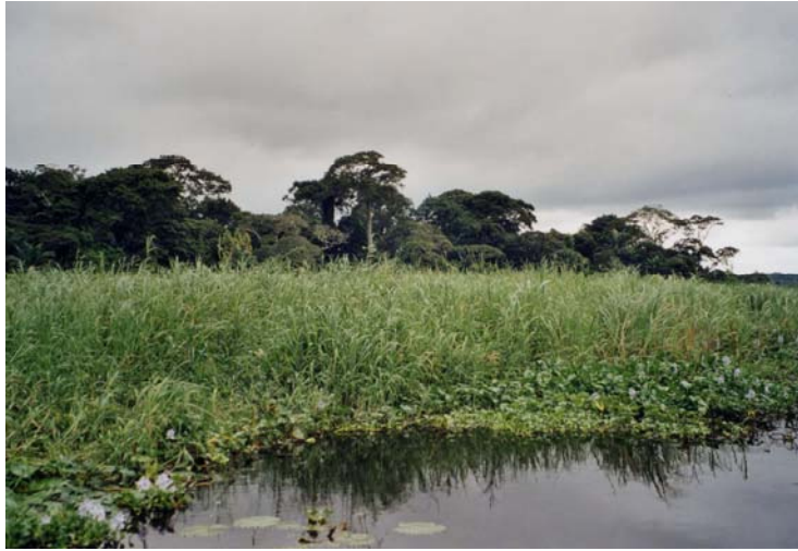
Chenal d'accès à Bamèzoun depuis le fleuve Ouémé