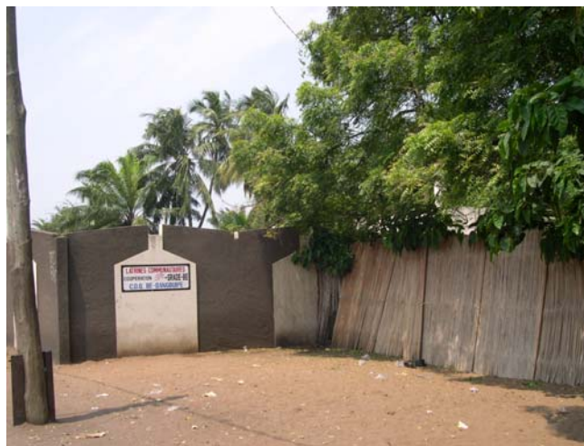
Le deuxième îlot de Bè, Dangbikpé, est mieux protégé : latrines et palissade limitent les incursions

immédiate et assurent l'entretien ; les adeptes s'occupent de tailler les branches des arbres pour réduire l'expansion de la végétation dans les cours des maisons avoisinantes, ce que nous avons pu observer. Des mesures ont d'ailleurs été prises par les prêtres pour limiter l'envahissement de ce bois par les ordures jetées par les habitants : une palissade édiflée en 1999 ferme le côté de la forêt donnant sur la voie. Les mesures actuelles de protection de l'environnement et d'assainissement de la ville devraient participer à ce mouvement de conservation. Mais aucune volonté d'exploiter ces deux îlots sur le plan touristique ne s'est manifesté, et l'îlot le mieux protégé et donc le mieux conservé ne figure pas sur la liste des paysages culturels du Togo, les cérémonies qui s'y déroulent demeurent secrètes et réservées aux initiés, même si le rayonnement spirituel de l' Avefio s'étend bien au-delà des limites du territoire qu'il est censé contrôlé. Quant au second, Hunvemè , la Direction des Eaux et Forêts ne le connaît même pas, bien qu'il figure sur le plan de la ville et les botanistes considèrent qu'il n'existe plus devant la pauvreté de la flore encore présente dominée par des nims ( Azadirachta indica ), espèce importée, et des baobabs.