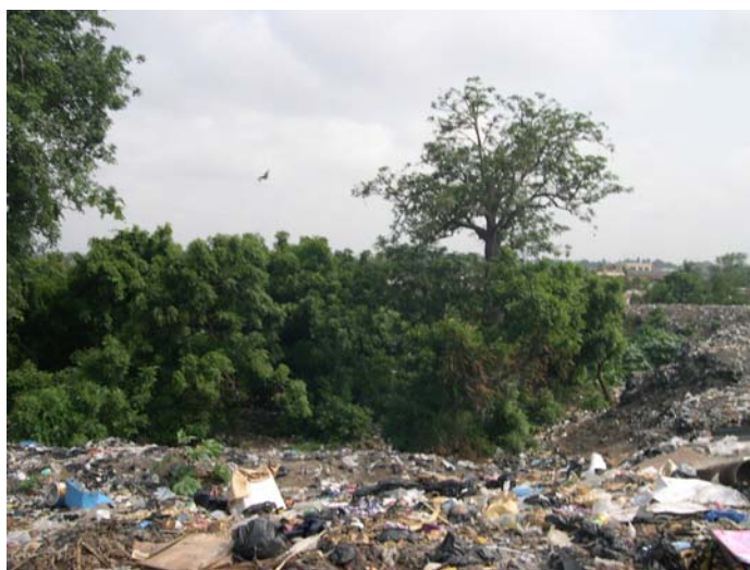
L'enfouissement progressif de la forêt sacrée de Bé à Lomé sous les ordures

Or, cet îlot, appelé Hunvemé , est entouré de déchets amoncelés depuis des années ; il sert de latrines publiques et de refuge à de jeunes marginaux qui y ont installé des habitats précaires. A. de Surgy ne mentionne pas l'existence de ce second site, qui s'oppose au premier par son abandon apparent. Une tentative de réhabilitation au début des années 1990 avec la construction d'un mur, l'aménagement de la voirie et de latrines publiques, l'installation de bancs pour créer un espace public de détente n'a malheureusement pas enrayé le processus qui s'est au contraire aggravé à partir de 1992 et les années qui ont suivi en liaison avec la grave crise politique et économique qui a alors secoué le pays. Les autorités publiques qui avaient commencé le déblaiement des ordures ont cessé toute activité et la situation sanitaire du quartier est aujourd'hui dramatique (des cas de choléra sont signalés périodiquement). Des ONG (dont Care international ) ont pris en parti le relais et des jeunes du quartier participent également à l'organisation du stockage des déchets dans ce qui est devenu un dépotoir secondaire et reconnu comme tel par les services de la voirie de la ville de Lomé. De temps en temps, une partie des ordures est évacuée vers la décharge finale à Agoè.