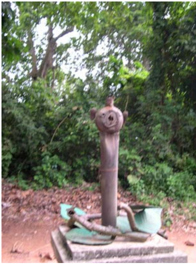
Représentation d'Aziza, génie de la forêt en matériau de récupération en 2004