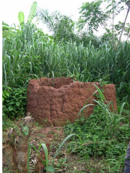
Ancien lieu de culte dédié à Sakpata, divinité de la variole. Seuls les murs restent et aucune trace d'offrande n'est visible.

depuis 2000, ainsi que le Maire d'Allada dont dépend le village d'Ahouannozoun depuis 2002, ces deux instances administratives reconnaissant ses droits. Cependant, ses actions doivent être entérinées par l'administration. Les lieux de culte montrent actuellement un état d'abandon. Dans ce cas, ce ne sont pas les pratiques religieuses mais le besoin de développement de l'économie locale et la volonté de conserver le patrimoine culturel et naturel local qui justifient les actions de ce responsable. (Ahouannozoun, 20/07/2004).