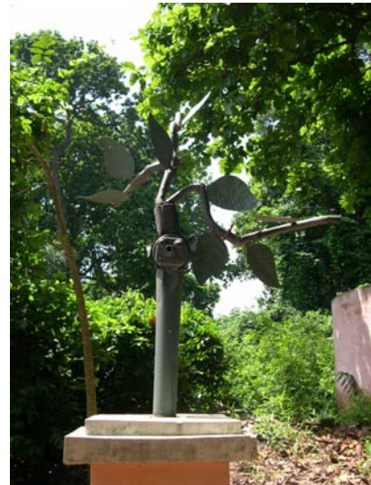
En 2006 après restauration

L'aménagement de cette forêt en 1992 s'est donc accompagné de l'ouverture au public, y compris certaines cérémonies. Ainsi, un événement interprété comme surnaturel et donc interprété comme la manifestation d'un vodou (un arbre abattu au cours d'un orage s'est redressé 41 jours après), survenu en juin 1988, a fait l'objet en juillet 1998 d'une cérémonie religieuse afin de commémorer le dixième anniversaire de l'événement. Cette fête a eu lieu pour la première fois le 14 juillet 1998 et depuis, elle est célébrée à nouveau chaque année à la même date. J'ai assisté en 1999 à cette cérémonie ouverte à tous, avec invitations de nombreuses personnalités officielles ; elle s'est déroulée selon des pratiques culturelles empruntées aux religions chrétiennes, avec un discours sous forme de prêche, quête propitiatoire et communion finale de noix de cola.