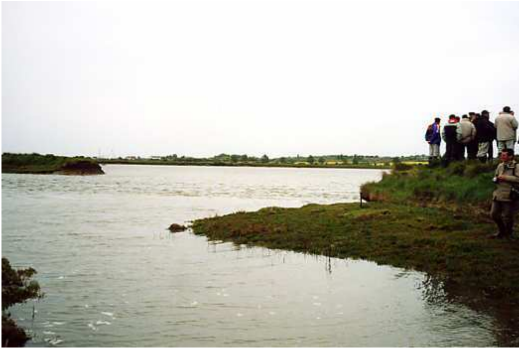
Document 1 : Site dépoldérisé de Tollesbury (Essex, Angleterre) : des visiteurs sur la digue, près de la brèche laissant revenir l'eau de mer (photo : V. Bawedin, mai 2003).

Ces deux exemples anglais montrent l'attention portée par les pouvoirs publics aux phénomènes de lutte contre l'élévation du niveau de la mer, d'une part, de protection de l'environnement d'autre part, les deux étant ici complémentaires. Cela traduit une anticipation, une vue à long terme dont ces travaux sont la résultante, fait relativement rare quand il s'agit de gestion du littoral.