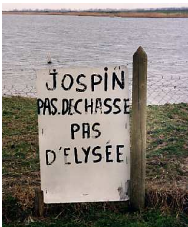
Document 3 : « revendications » des chasseurs de gibier d'eau dans les Bas-champs de Cayeux

Ainsi, la propriété privée, plus que la chasse, est un facteur qui peut impulser le choix du maintien en l'état des Bas-champs.