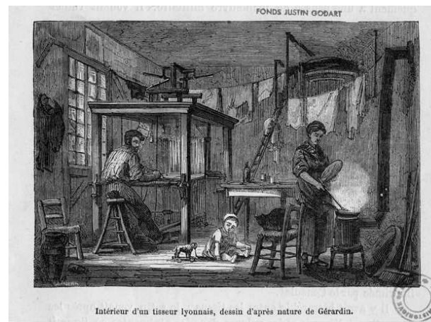
Musée Gadagne. Fonds Justin Godart 45 .

combattre l'absence de cette égalité que les journalistes de l'Echo travaillent. En décembre 1832, Chastaing regrette que les lois ne se soient pas assez occupées « de la femme, cette intéressante moitié du genre humain » ; et il ajoute aussitôt : « quelque chose doit compenser pour elle l'absence de tous droits politiques » 44 . On ne saura pas ce qu'est cette chose ; mais ce ne sera pas l'égalité.