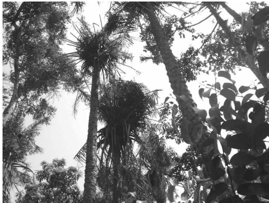
Figure 2.— Nids de chimpanzés établis au sommet des Elaeis guineensis dans une forêt-galerie de Kanfarandé.

A cette utilisation remarquable du palmier à huile par les chimpanzés s'ajoute la consommation de la moelle des jeunes feuilles dont nous avons observé les traces. Les rachis dont l'extrémité a été mâchée, ainsi que des inflorescences mâles avec un pédoncule délité jonchent le sol aux alentours des palmiers.