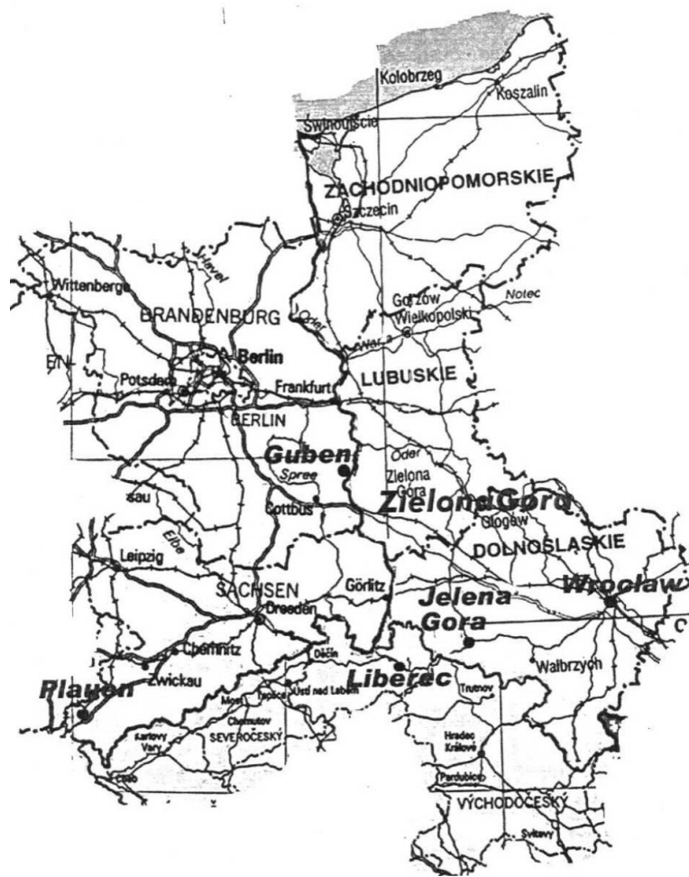
Mapa N°2: Euroregion tekstylny.