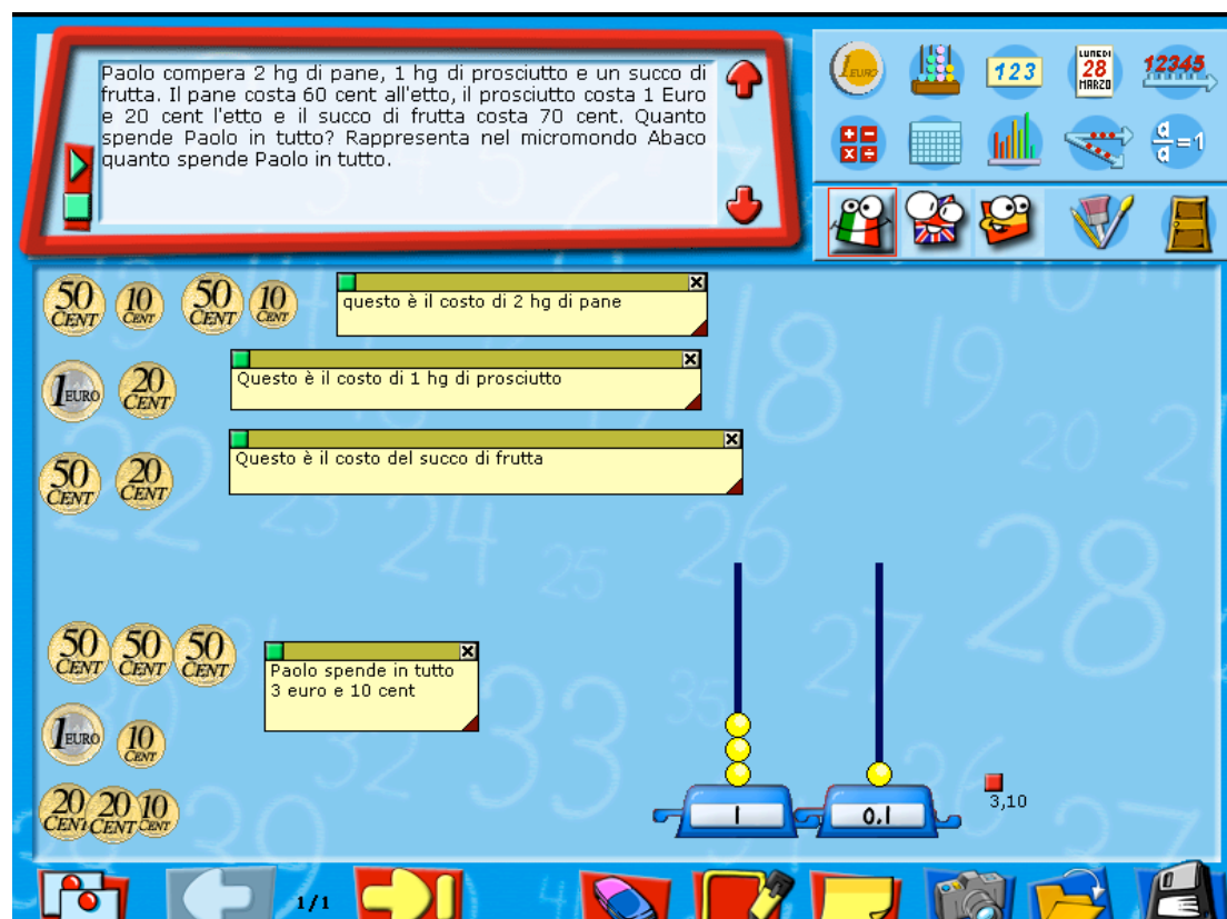
Figura 1: Interfaccia del foglio soluzione con un esempio di soluzione.

In questo ambiente l'utente può incollare rappresentazioni costruite nei micromondi (in questo caso in Euro e in Abaco), può inserire commenti per mezzo di "post-it", può aggiungere pagine, stampare la soluzione costruita, cancellare il lavoro fatto. Dal Foglio Soluzione si può accedere ai micromondi, selezionando le icone visualizzate in alto a destra. Il foglio soluzione, così come tutti gli altri strumenti di ARI@ITALES, è disponibile in tre lingue comunitarie: l'italiano, l'inglese e lo spagnolo.