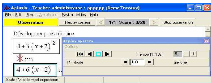
Figure 1. Vérification de nos hypothèses d'interprétation à l'aide du magnétoscope.

Donnons en un exemple : un élève transforme 4 + 3(x + 2)^2 en 10(x + 2) . En rejouant ce que cet élève a pu effacer comme calcul, il apparaît que 4 + 6(x + 2) est une étape "cachée" intermédiaire à son calcul, comme le montre l'impression de l'écran, Figure 1. Ainsi avons-nous interprété la transformation erronée comme une succession de deux règles : « ax^n \rightarrow nax » et « a + bc \rightarrow (a + b)c ».