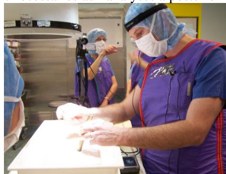
FIG. 2 – (à droite) Observation du chirurgien utilisant les prototypes d'outils lors de l'émulation.

Lontchamp (2004) nous a largement inspiré pour proposer un modèle de processus de conception co-évolutive représentant la progression du prototype et de son utilisation (figure 3). Ce modèle met très l'accent sur l'importance des modifications à apporter également aux émulations dans le processus de conception: à partir de discussions avec les concepteurs, les prototypes sont proposés et fabriqués. En parallèle, l'utilisation de ces outils est débattue avec les chirurgiens et finalement proposée. Ce n'est finalement que lors des émulations qu'il y a effectivement des confrontations entre les deux évolutions simultanées.