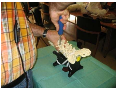
FIG. 1 – (à gauche) Préparation du mannequin : Pré positionnement de trois vis dans les pédicules des vertèbres.

L'émulation s'est ensuite déroulée en bloc opératoire avec le matériel utilisé ordinairement par le chirurgien et son équipe. Elle a débuté à l'étape spécifique précisée dans l'« histoire » (vis pédiculaires en place sur la colonne) et s'est terminée une fois l'implant totalement mis en place. Sur la figure 2, nous pouvons observer le chirurgien en train d'utiliser les prototypes d'outils. Nous y repérons également les instruments annexes utilisés lors de l'expérimentation (caméras, micro) pour récupérer les informations qui seront nécessaires aux analyses a posteriori.