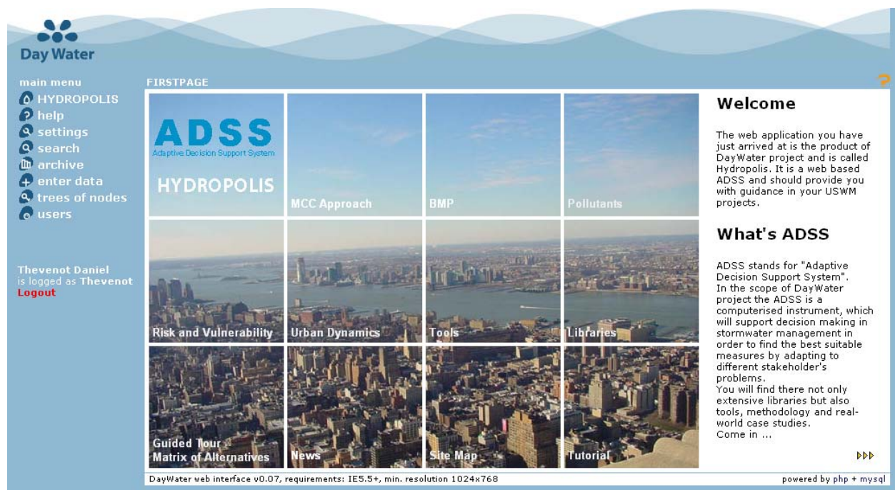
Figure 2. Hydropolis, interface graphique du S2AD DayWater

Le S2AD est un outil informatique basé sur une interface web (Figure 2). C'est avant tout un portail documentaire sur le contrôle à la source des eaux pluviales urbaines, mais c'est aussi un outil d'aide à la décision dans le sens où il offre un support à l'identification des problèmes et un guide au choix de solution.