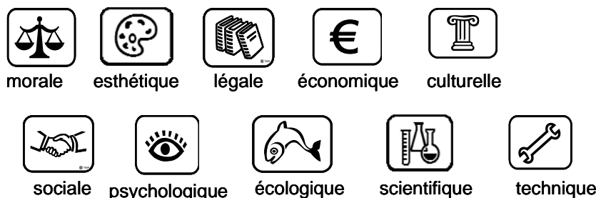
Figure 4. Différentes valeurs de l'eau (Aspects of Water).

Enfin une base de données recensant plusieurs études de cas ( Case studies ) peut aussi être consultée et alimentée par les utilisateurs du S2AD. La structure de cette base de données permettra aux utilisateurs de « raconter » une grande variété de projets selon leurs aspects à la fois techniques et contextuels.