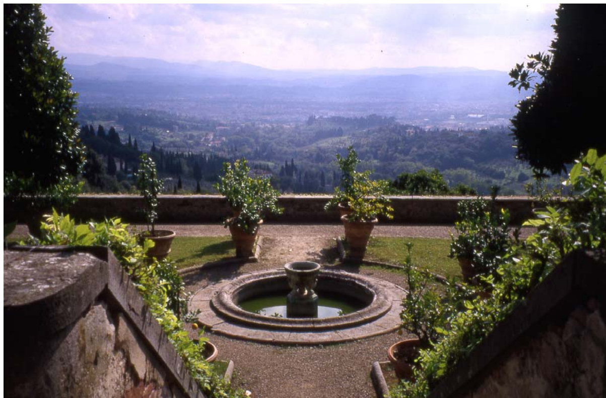
2. La finitude ouverte : villa Médicis à Fiesole (Florence).

et de représenter la ligne de tension instable par laquelle ils s'accolent. En fait, la clôture est l'axe d'un jeu duel entre l'intérieur et l'extérieur qui s'accomplit dans un rapport formel 31 ». On pourrait ainsi revisiter l'histoire des jardins uniquement à partir de cette dialectique de la limite qui amène à reconsidérer la manière dont le jardin dialogue avec le paysage.