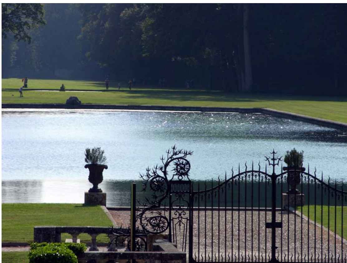
4-5. Les temporalités du jardin comme système vivant : Courances (Essonne). Long de 500 mètres, le canal appartient à un réseau hydraulique mis en place à la Renaissance. Plantés il y a un demi-siècle, ces peupliers devront être remplacés durant l'hiver 2006-2007. Installé avant 1756, le miroir d'eau qui souligne l'axe central est un dispositif à capter la lumière d'un instant.