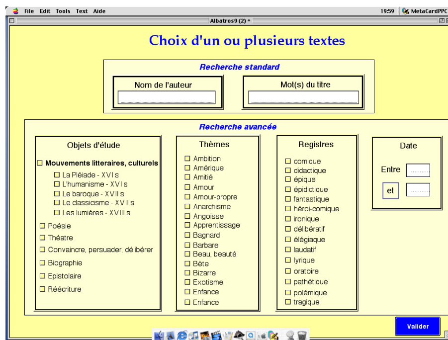
Figure 1. Interface de sélection d'un ou plusieurs textes

A l'heure actuelle, seul le module de visualisation est en cours de développement. Il offre à l'élève la possibilité dans un premier temps de sélectionner un texte particulier. Pour effectuer ce choix, différents critères de sélection lui sont proposés : par auteur (le nom de l'auteur), par mot du titre (un ou plusieurs mots du titre de l'œuvre ou de l'extrait), un objet d'étude (poésie, théâtre, biographie...), un thème littéraire (la mort, l'amour, la souffrance...), un registre (lyrique, pathétique, polémique...) et une date (Fig 1). Bien sûr, l'élève a la possibilité d'effectuer son choix à partir d'un ou plusieurs de ces critères.