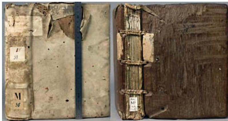
Orléans, BM 38 (début XVI e s.) — Orléans, BM 166 (début XVI e s.)

Angers pour remettre en état leurs livres, ceux de Saint-Benoît-sur-Loire entreprirent le travail eux-mêmes. C'est ce que tend à montrer la manière si frustre utilisée pour refaire, toujours vers 1510, une cinquantaine de reliures : dans la mesure du possible, les matériaux provenant d'anciennes reliures ont été réutilisés selon des techniques très rudimentaires. C'est pourquoi leur datation a posé tant de problèmes aux catalogueurs : telle reliure a été refaite au début du XVI e siècle en employant des matériaux provenant d'une reliure du XIII e siècle.