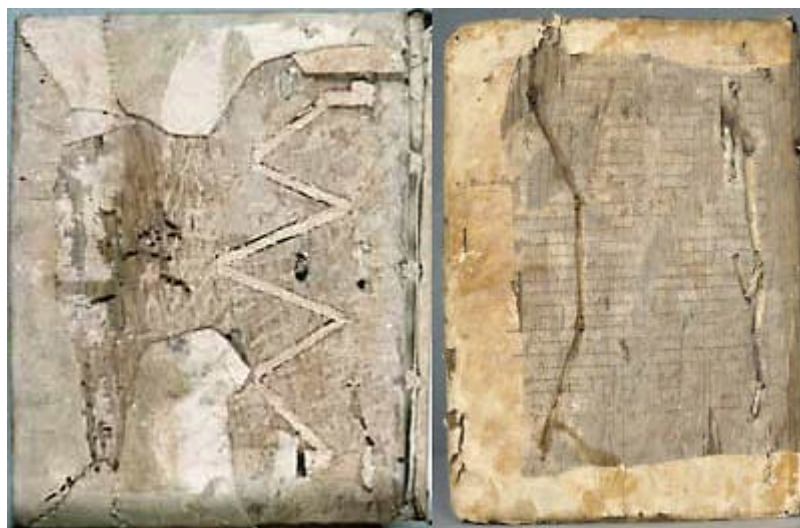
Vendôme, BM 31 (XI e s.) — Orléans, BM 295 (XII e - XIII e s.)

Pour conclure : un pourcentage très élevé de reliures médiévales date du début du XVI e siècle. L'étude de la reliure montre que les bibliothèques ont été pendant tout le moyen âge l'objet d'un soin constant. Faut-il évoquer des préoccupations économiques dans la tendance à réutiliser sans cesse les mêmes matériaux ? Peut-être. Les problèmes de datation posés au catalogueur sont énormes, puisqu'il lui faut sans cesse déterminer l'origine du matériau qu'il décrit et dater la façon.