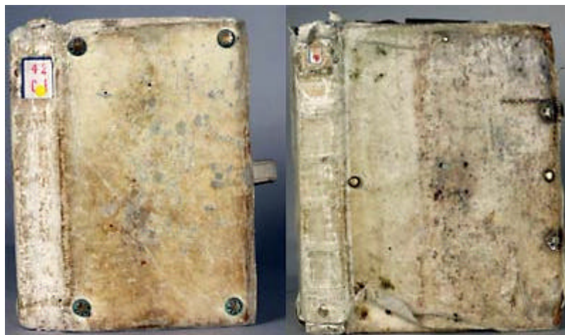
Laon, BM 42 (1 re moitié du XII e s.) — Laon, BM 240 (2 e moitié du XIII e s.)

Si cet ensemble est facilement identifiable par son aspect, un examen plus attentif montre qu'il n'en est pas deux qui soient identiques. Il n'y a pas l'ombre d'un train de reliures. Nous sommes devant un ensemble dont les caractères, décrits dans le paragraphe précédent, s'appliquent à une trentaine de manuscrits dont la plupart a été copié entre le milieu du XII e siècle et le milieu du XIII e .