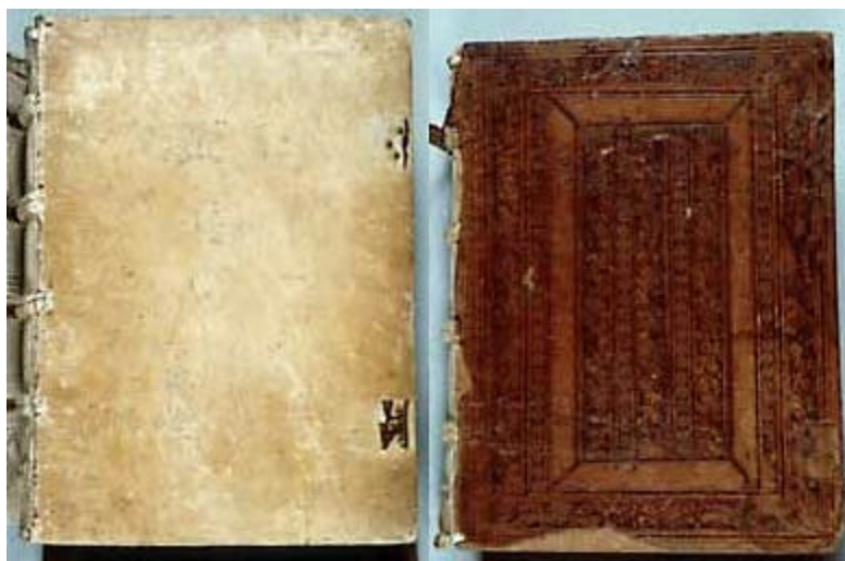
Vendôme, BM 33 (début XVI e s.) — Vendôme, BM 40 (début XVI e s.)

À la Sainte-Trinité de Vendôme , deux trains de reliures furent exécutés en même temps (les défets proviennent dans l'un et l'autre des mêmes manuscrits). 6 Ils ont concerné plus du quart du fonds de manuscrits 7 et quelques imprimés. Ils se caractérisent par une technique archaïque, des tenons de fermoirs identifiables, des tranchefiles de peau mégissée tressée sur bâti, etc. Ces deux trains sont parfaitement identifiables par leur couverture, l'une en peau de mouton mégissée, l'autre en veau estampé à froid de filets et de roulettes.