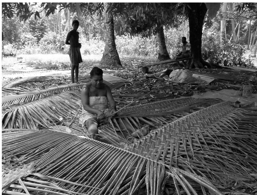
Figure 3 : Fabrication de nattes en feuilles de cocotier. Ambrym, Vanuatu

Le tableau 3 détaille les différents usages et produits tirés du cocotier recensés au Vanuatu. Outre l'importance du coprah dans l'économie du ménage, le cocotier est consommé quotidiennement pour son eau ou le lait extrait de l'albumen des noix mures. Ses feuilles sont utilisées pour les murs et toits des abris de jardin ou tressées en nattes ( figure 3 ). Au-delà de ces usages domestiques, des noix peuvent être offertes lors d'une cérémonie de mariage. L'eau de coco peut être utilisée comme excipient pour la préparation de plantes médicinales ou en association à des pratiques magiques.