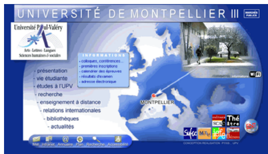
Figure 3 : Université de Montpellier 3