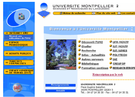
Figure 2 : Université de Montpellier 2