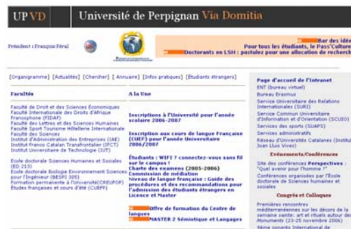
Figure 4 : Université de Perpignan