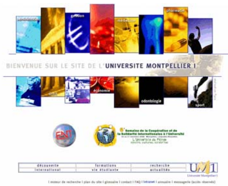
Figure 1 : Université de Montpellier 1

Aussi en octobre 2006, est apparu sur chacun des sites universitaires de la région Languedoc Roussillon cet accès sur les pages d'accueil des sites universitaires :