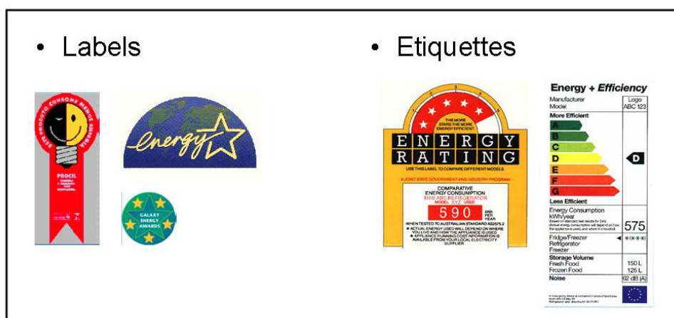
Tableau 1 : Exemples de labels et étiquettes Energie

L'étiquette énergétique ("comparison label") permet de comparer entre elles les performances énergétiques de tous les produits dans une catégorie donnée (réfrigérateurs/congélateurs, sèche-linge, lave-linge, etc) : ex EnergyGuide aux USA ou l'étiquette Energie en Europe. Les labels ("endorsement label") permettent uniquement de distinguer les appareils les plus performants : ex. Energy Star – USA. Les premiers s'appliquent généralement à l'ensemble des produits disponibles, alors que les seconds relèvent d'une démarche volontaire de la part des industriels.