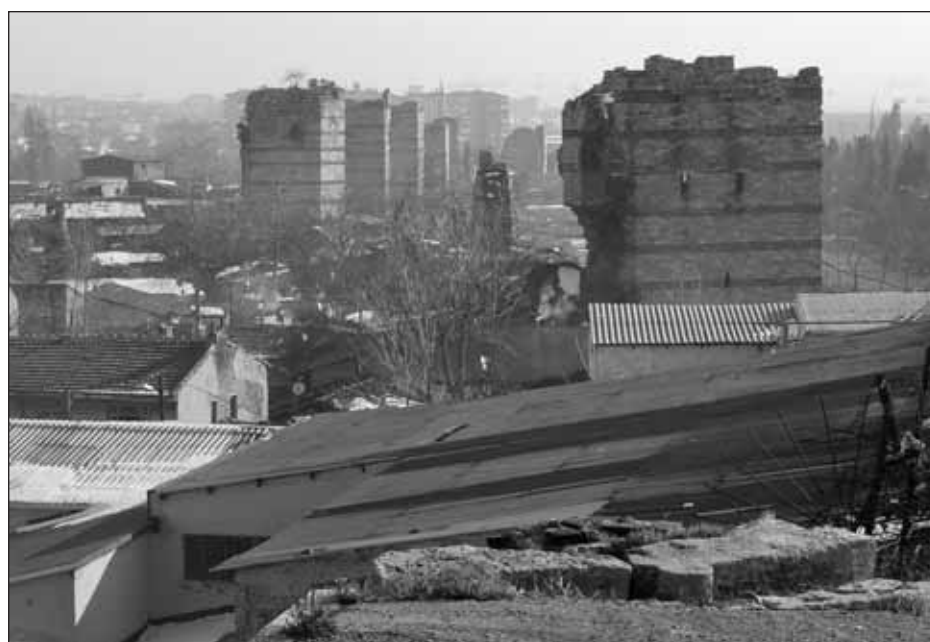
La muraille Théodose II et l'environnement urbain (Turquie).