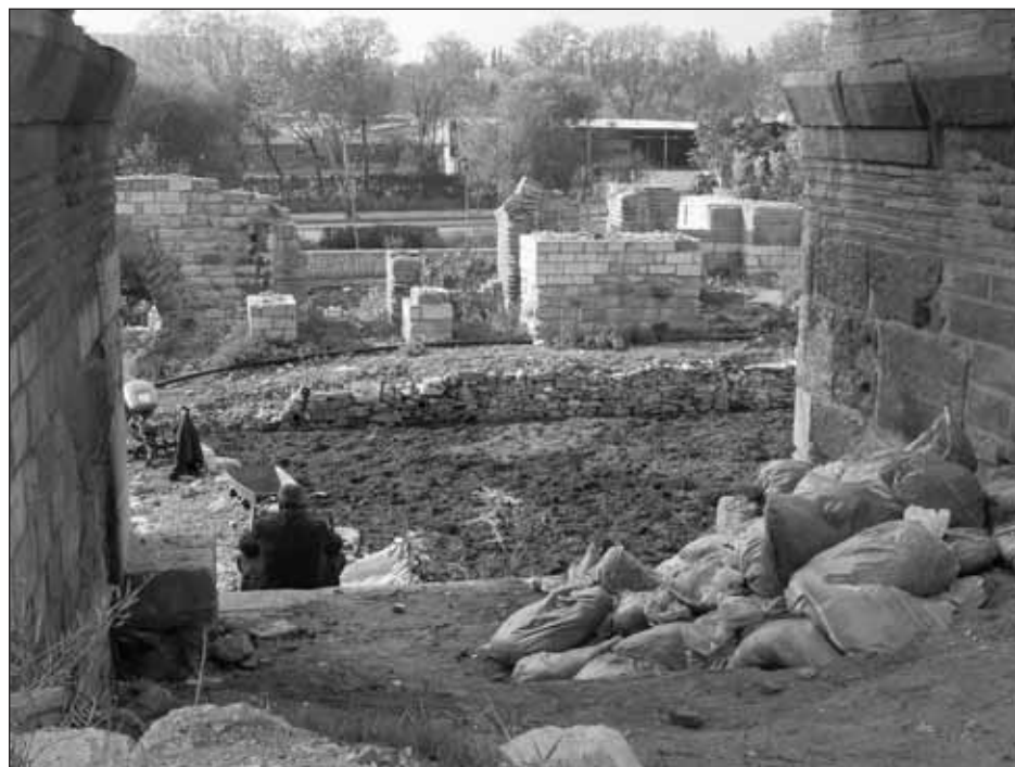
Le manque de muséification de la muraille Théodose II (Turquie).

Paradoxalement, en risquant de briser les liens avec l'UNESCO, la municipalité semble développer un projet de mise en valeur assez proche des canons internationaux du « patrimoine » : accessibilité sécurisée par