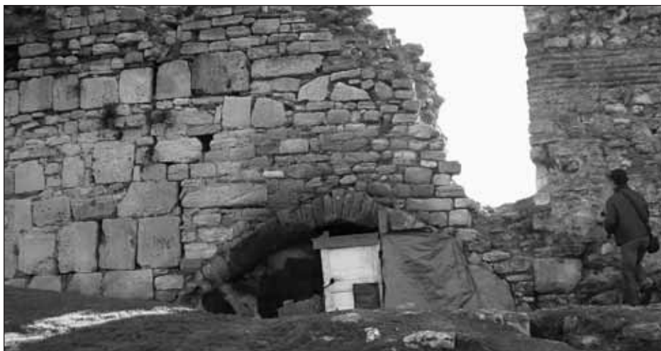
Un abri de fortune à l'intérieur de la muraille Théodose II (Turquie).

Le risque le plus fréquemment invoqué reste toutefois l'agression – le plus souvent humaine ou par les bandes de chiens errants. Quels que soient les jugements moraux portés sur les usages de la muraille, toute présence sur un espace comporte une part d'appropriation, même labile. Les réactions hostiles peuvent alors être vues, dans certains cas, comme des défenses de territoire. Concrètement, certains usages présents sur la muraille, illégaux ou non tolérés par les habitants des quartiers voisins, viennent précisément y chercher l'invisibilité. Une arrivée impromptue sur les lieux peut facilement déclencher une réaction agressive ; c'est le cas des petits trafics ou des rencontres secrètes. Quelques incidents peuvent également survenir avec les personnes ivres. L'accueil, d'abord cha-