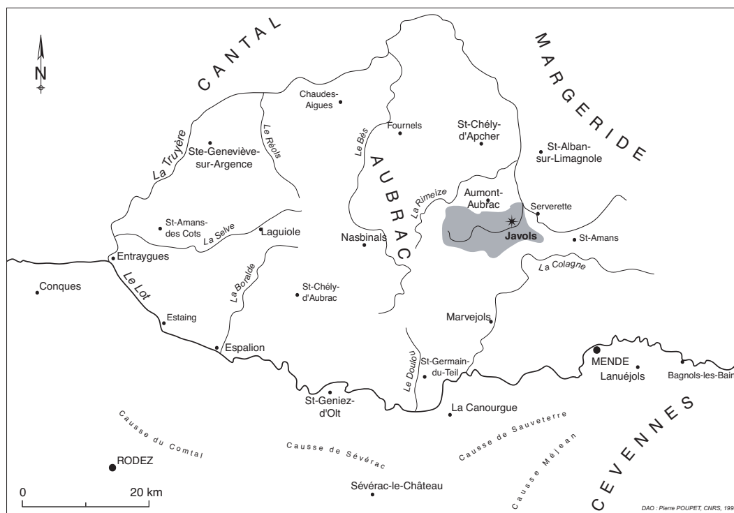
Fig. 2 : Javols entre Aubrac et Margeride. Carte des principales régions naturelles et du système hydrographique Lot-Truyère.

En grisé, le bassin versant de la rivière, le Triboulin (infographie P. Poupet).