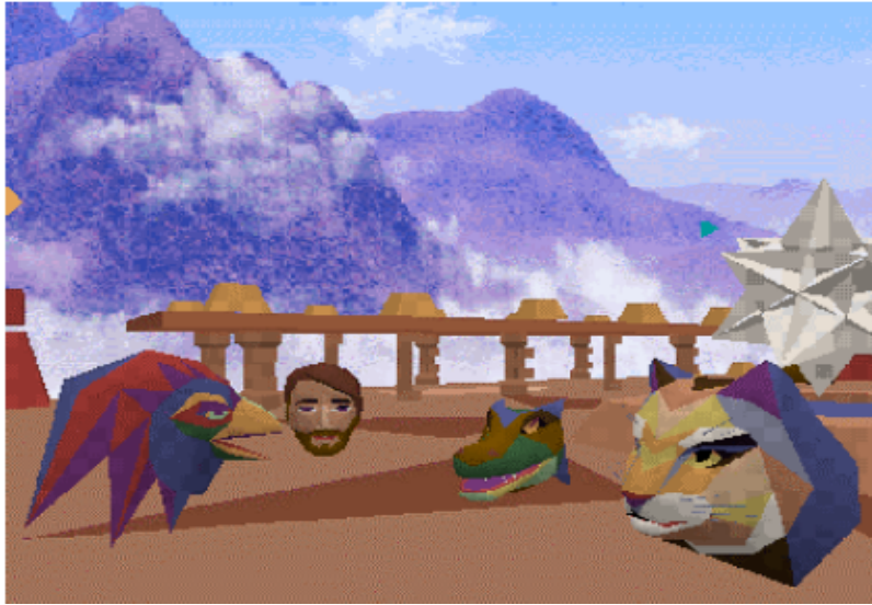
Figure 2 : l'environnement Traveler http://www.digitalspace.com/avatars/traveler.html

La comparaison avec le design de Lyceum fait apparaître la forte structuration architecturale de ce dernier, avec ses salles carrées, et ses étages rappelant ceux d'un établissement universitaire (flèche 1 sur la Figure 1), alors que le design de Traveler évoque le monde mystérieux des jeux et aventures vidéo. Autre différence majeure : l'utilisation de Traveler se fait en trois dimensions (on appuie sur les flèches de son clavier pour faire aller, venir, voler et virevolter son avatar, lui faire froncer les sourcils ou le faire sourire). Lyceum, de son côté, a une dynamique qui repose non pas sur des mouvements mais sur des changements : changements de salle, modifications en temps réel d'un texte, d'une forme ou d'une couleur, et changements de volume, de rythme et d'intonation propres à la conversation orale. Dernière différence : Traveler permet de rester anonyme (hormis la voix de l'utilisateur, qui est potentiellement identifiable) alors que Lyceum affiche en permanence le nom des connectés, et « flashe » systématiquement le nom de toute personne modifiant un état existant, comme c'est le cas pour RobinG qui dessine une bulle dans la Figure 1 (flèche 6).