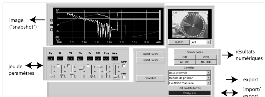
Figure 1. Vue éclatée d'une applet d'expérimentation et des types de données exportées